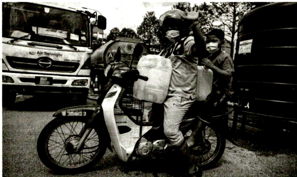
SEORANG penduduk mengisi air daripada tangki air awam yang disediakan di Lorong Raja Muda Abdul Aziz, Kampung Baru, Kuala Lumpur akibat gangguan bekalan air pada 11 November lalu.