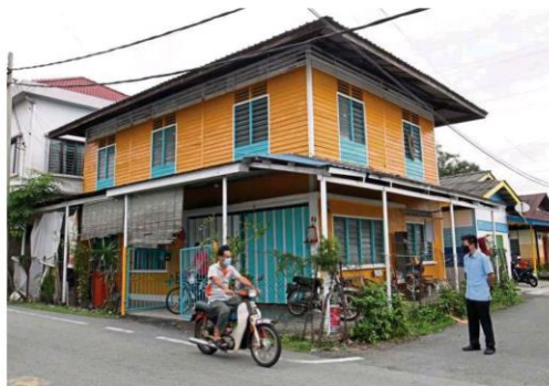
Aptly called the Warna-Warni project, the rejuvenation involves painting between 60 and 70 wooden houses with bright colours to revitalise the outlook of the village.